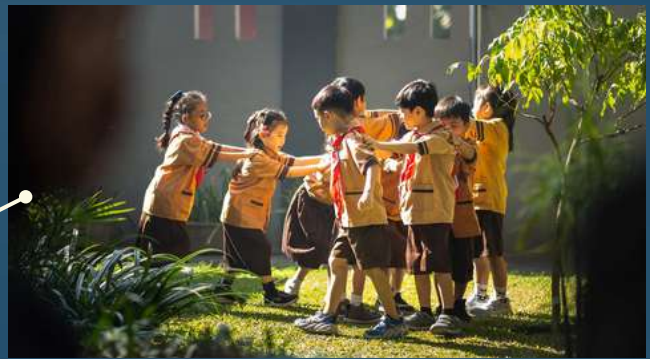
“Indahnya Dunia Anak”