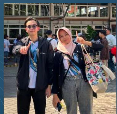
TIM BADMINTON GANDA CAMPURAN