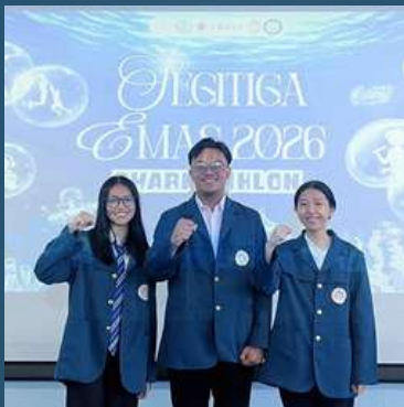
TIM CERDAS CERMAT

Segitiga Emas (SE) adalah ajang tahunan yang mempertemukan mahasiswa Farmasi dari Universitas Airlangga, Universitas Hang Tuah, Universitas Katolik Widya Mandala Surabaya, dan Universitas Surabaya. Dalam pelaksanaannya tahun ini, sebanyak 13 cabang perlombaan dipertandingkan dengan Universitas Hang Tuah sebagai tuan rumah. Fakultas Farmasi Universitas Airlangga berhasil menorehkan prestasi membanggakan dengan meraih gelar juara pada enam cabang, meliputi cerdas cermat, futsal, dance, voli, badminton tunggal putra, dan badminton campuran.