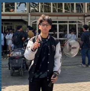
TIM BADMINTON TUNGGAL PUTRA